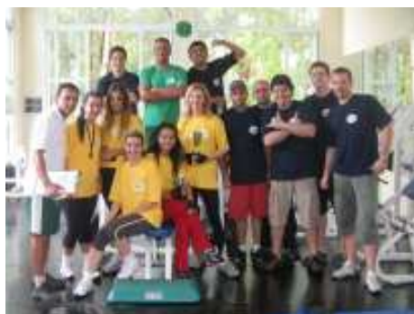
A turma que disputou o III Torneio Interno de Supino Reto do Alpha 4

Teze atletas da academia de fitness do Alpha 4 disputaram o III Torneio Interno de Supino Reto promovido dia 8 de novembro pelo Departamento de Esportes. Destinada principalmente para o desenvolvimento dos músculos peitorais maiores, a modalidade é considerada um dos exercícios mais clássicos nas academias de musculação em todo o mundo.