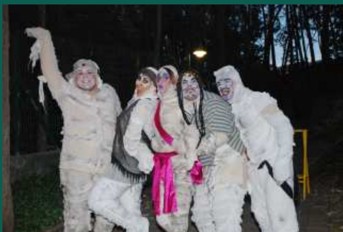
Família das múmias incumbida de dar as boas vindas aos convidados da festa