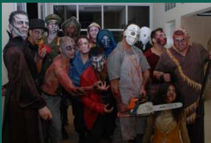
A trupe de monstros do Play-Center, que garantiu os sustos aos convidados que tiveram coragem de enfrentar o Túnel do Terror

Uma trupe de monstros do Play-Center especialmente convidados animou a festa do Halloween do Alpha 4, realizada na noite do dia 1º de novembro.