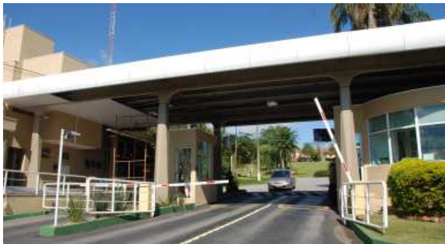
Essa é a primeira grande reforma da Portaria, inaugurada em julho de 1999

AS MUDANÇAS - Os operários estão substituindo o revestimento metálico em forma de colméia por chapas lisas de PVC. O novo sistema de iluminação será embutido na estrutura da portaria, que ganhará também cortes na platibanda do lado interno da entrada e saída de serviço. O forro nestes espaços acompanhará a inclinação do terreno, o que vai facilitar a entrada e saída dos veículos.